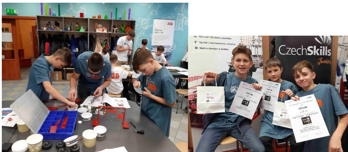
OBRÁZEK 8: ZE SOUTĚŽE