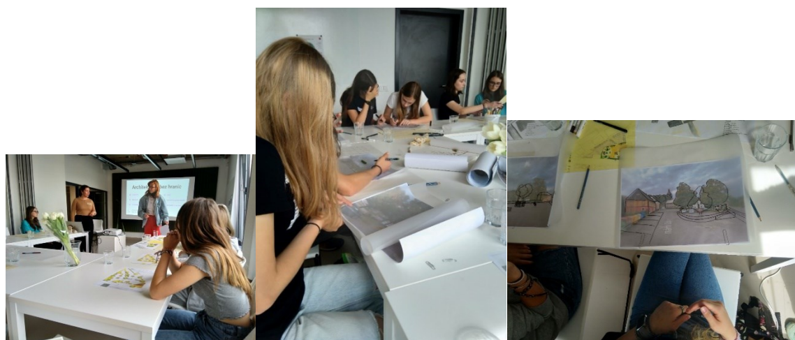
OBRÁZEK 4: SETKÁNÍ S ARCHITEKTKAMI

Workshop se mohl uskutečnit díky finanční podpoře, kterou poskytla Nadace Preciosa.