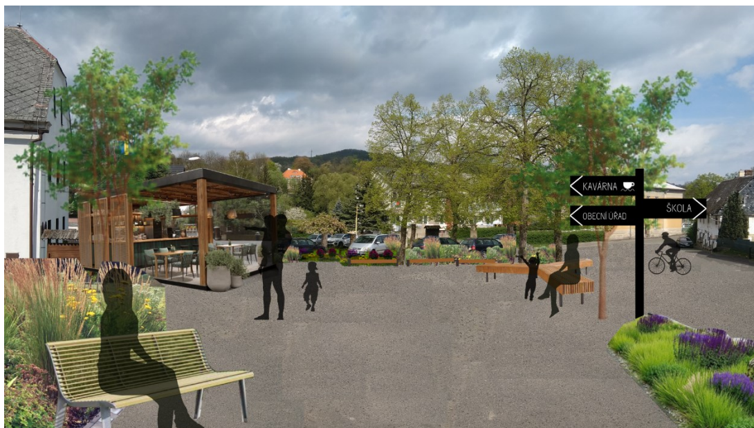
OBRÁZEK 5: VIZUALIZACE ŽÁKŮ