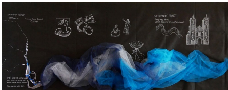
OBRÁZEK 6: VÝZDOBA VESTIBULU

Tento projekt se prolínal školním rokem a jeho zaměření nebylo pouze na díla Bedřicha Smetany, ale přesahoval i do dějepisu, zeměpisu, občanské výchovy, člověk a jeho svět.