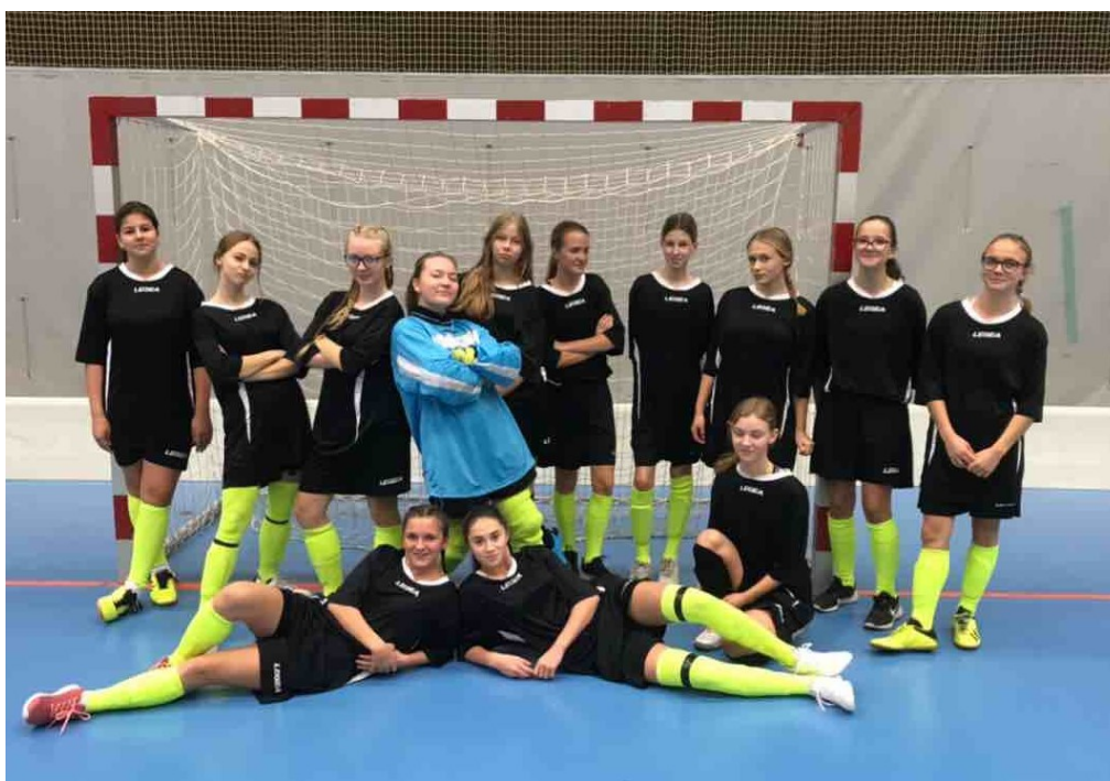
OBRÁZEK 2: DÍVKY 8. A 9. ROČNÍKU

Více příležitostí dostali žáci a žákyně 2. stupně v různých fotbalových soutěžích. Chlapci z 6. až 9. ročníku si mohli zahrát několikrát, účastnili se turnaje UEFA a FAČR Grassroots ve velké kopané na městském stadionu v České Lípě, kde hráli na venkovních plochách, jak na trávě, tak na umělém povrchu, uvnitř si pak zahráli v rámci školské futsalové ligy, mladší (6+7) i starší (8+9) chlapci v nové sportovní hale v České Lípě. Letos nevynechali ani utkání mezi školami ve Verneřicích. Naše dívky se dostaly do semifinále v Praze a své zápasy odehrály v multifunkčním areálu Jedenáctka na Chodově.