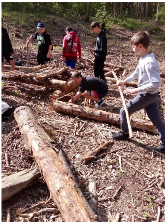
OBRÁZEK 9: HÝBEJME SE - 7.R.

Projektové dny „Hýbejme se“ máme zakotveny v ŠVP: žáci upevňují vztahy, plní úkoly, pohybují se, učí se a zároveň užívají legraci.