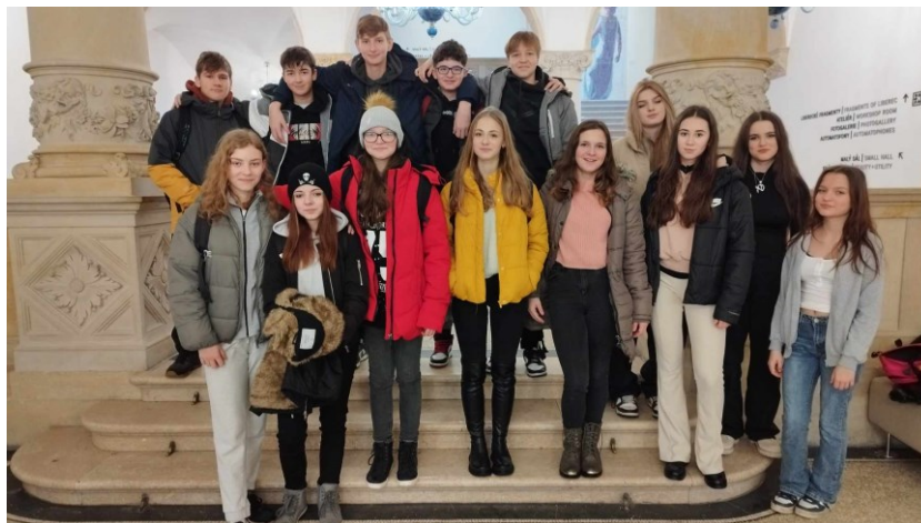
OBRÁZEK 3: Z MUZEA

vše nutilo žáky klást si otázky: Jak se stalo, že odešli? Proč tu všechno nechali? Odpověď nám mohou dát konfiskované předměty, a především příběhy jejich původních majitelů.